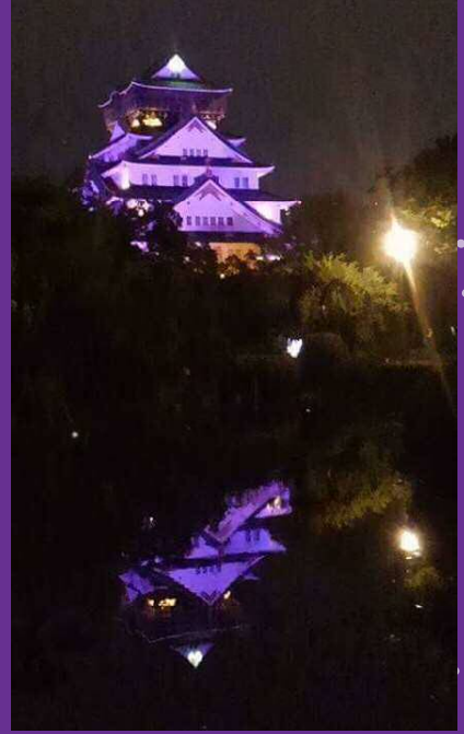
大阪城ライトアップ 10/7 (土) 日没予定