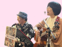
SHU & MACHIKO