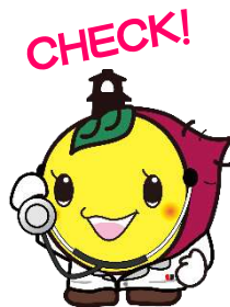
川越市マスコットキャラクターときも