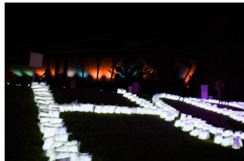
当日会場に飾られたルミナリエバッグ