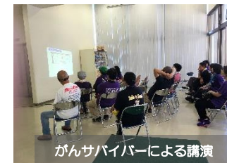
がんサバイバーによる講演