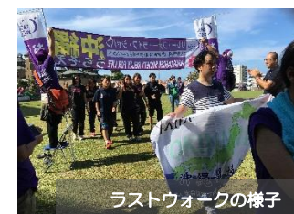
ラストウォークの様子