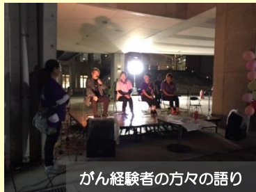
がん経験者の方々の語り