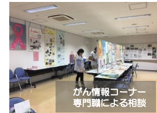
がん情報コーナー 専門職による相談