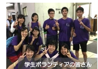
学生ボランティアの皆さん