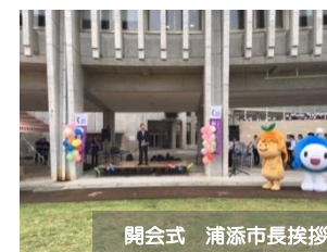
開会式 浦添市長挨拶