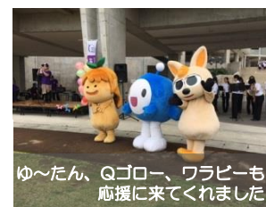
ゆ〜たん、Qゴロー、ワラビーも 応援に来てくれました