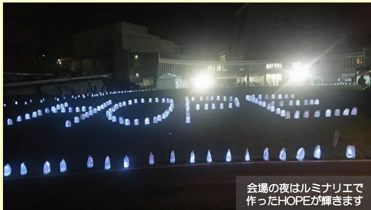
会場の夜はルミネリエで 作ったHOPEが輝きます