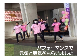
パフォーマンスで 元気と勇気をもらいました