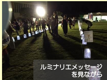
ルミネリエメッセージ を見ながら