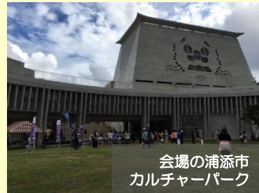
会場の浦添市 カルチャーパーク