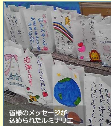
皆様のメッセージが 込められたルミネリエ

ちむぐる沖縄の心で無事イベントを終えました。 皆様の温かいご支援に感謝です！ ありがとうございました！