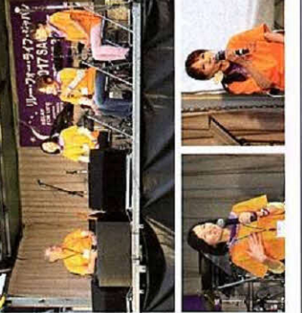
サバイバーズトーク