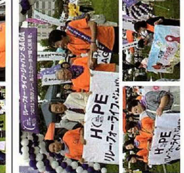
サバイバーズラブ