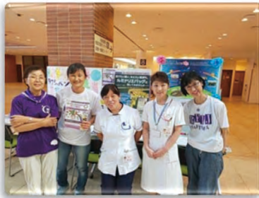
8/2・8/28 埼玉県立がんセンター