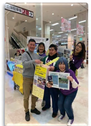
イオン浦和美園 「幸せの黄色いレシートキャンペーン」