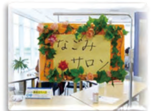
～がんと向き合う語らいの場～ 【なごみサロン】 毎月第3土曜日開催