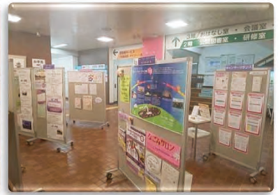
8/27～9/23 県立久喜図書館 (パネル展示)