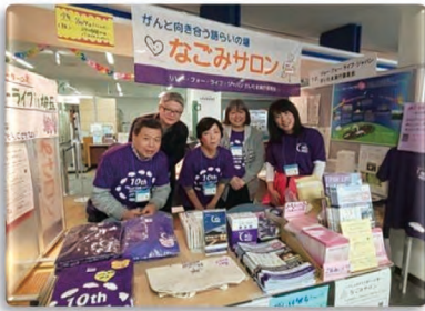
3/2～3 サポセンフェスタ