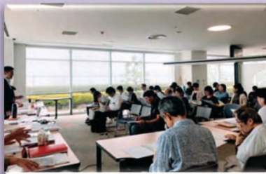
実行委員会11回・チーム合同会議5回開催