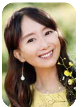
アグネス・チャン

リレー・フォー・ライフの合言葉は「Celebrate, Remember, Fight Back」 「命を祝う、亡くなられた方を偲び、未来の為にがんと闘う！」この精神を忘れずに、がんになっても大丈夫だと思えるような世の中に向けて、これからも頑張りましょう！