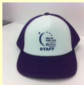
スタッフ用キャップ

マフラータオル：中央にHOPEのロゴをデザインしました ★バンダナ、マフラータオルともに紫色です。